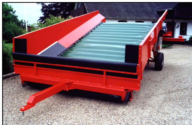
EM1180 vist med fingerrensere, jordbånd og reversibelt afleveringsbånd.